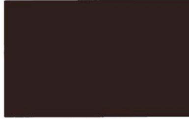
Mustang Brown Brun Mustang