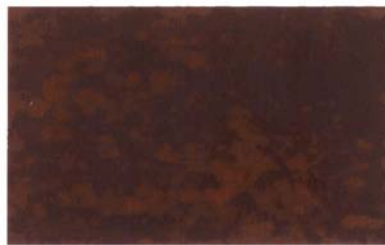
Adirondack Autumn Automne Adirondack

Colours may not be exactly as shown. Consult your Dealers