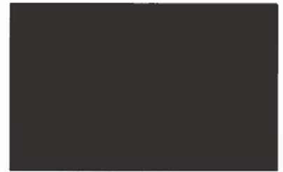
Granite Gray Gris Granite