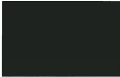
Alpine Evergreen Vert Alpin

TOUTES CES COULEURS D'ENDUIT FLUROPON® ONT UN EMBOSSAGE TEXTURÉ STRUC.